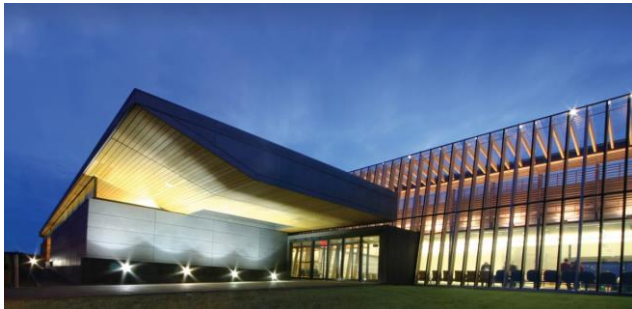
ARHITEKTURA, LES IN UREDBA O ZELENIH JAVNIH NAROČILIH